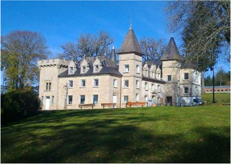
Entrée du restaurant :